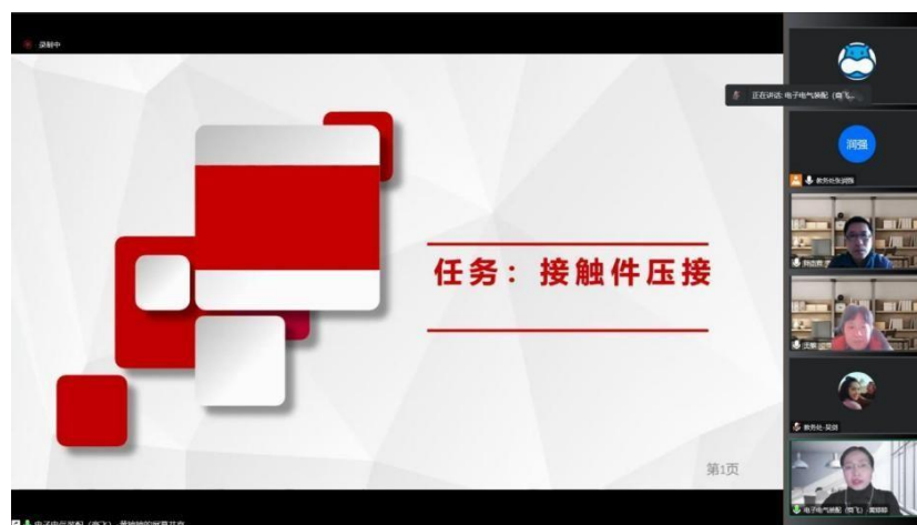
图1 疫情期间开展线上教学比赛

教师能力的提升。疫情期间使用网络教学平台教学、开展线上竞技，2022 年 22 支参赛团队 70 余名教师决赛中同台竞技，教师熟练使用信息化教学方式，信息技术应用能力快速提升，在教育教学中合理使用信息化资源，推进信息技术与教学有机融合，优化教学过程，提高教学效能。