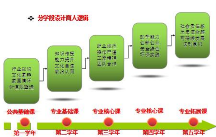
图2 贯通专业分学段育人逻辑

①按照学段及学生在每阶段的认知规律，统一确定每阶段的重点育人目标、职业能力与职业素养培养实施路径，发挥课程育人功能。